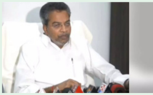
విజయవాడ జనవరి 14 (భారత్ శక్తి):

మాజీ ఎం జగన్మోహన్ రెడ్డి దుర్మార్గుడు. నయంపచకుడు అని, నవ్యాంధ్రప్రదేశ్ రాజధాని అమరావతిపై తన మనసులో ఉన్న విషాన్ని వెళ్లగక్కాడని మైలవరం ఎమ్మెల్యే వసంక వెంకట కృష్ణప్రసాదు గారు పేర్కొన్నారు. విజయవాడ రూరల్ మండలంలోని గొల్లపూడిలో ఎమ్మెల్యే వసంక కృష్ణప్రసాదు గారు మాట్లాడుతూ జగన్మోహన్ రెడ్డి విషపు వ్యాఖ్యలు, ఆయన విషపు మనస్తత్వానికి పులికిపెట్టాడు అప్పట్లోనే నైజాం నుంచి బయటకు వచ్చిపట్టు స్వస్థం చేశారు. పేనుకు పెత్తనం ఇప్పటికీ ఉన్న అవకాశం అంటూ అడిగిన జగన్మోహన్ రెడ్డికి అధికారం అప్పగించిన కారణంగా అనింటిలో అప్పట్లో బిల్లు పెట్టారని అన్నారు. అప్పట్లోనే ఆ బిల్లును తన పులికిపెట్టినట్లు స్పష్టం చేశారు. జగన్మోహన్ రెడ్డికి మన ప్రాంతం పట్ల పూర్తిగా ధ్వేషం ఉందన్నారు. ఏపీకి తలమనిపిస్తే ప్రాజెక్టులు పోలవరం, భీమావరం ఎయిర్పోర్ట్ పూర్తి కావడంతో విశాఖలో డేటా సెలక్షన్, రాయలసీమలో కంప్యూటర్ వసూళ్లను ప్రాంతాలకు అతీతంగా ప్రతి ఆంధ్రుడు సహాకరించుకున్నాడన్నారు.